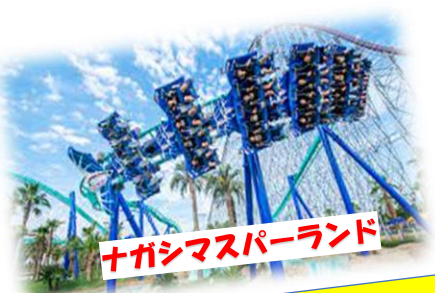
ナガシマスパーランド

とにかく空気がキレイでとても自然豊かな素晴らしい町で 梅の栽培が有名だった為、「うめぼ〜や」というゆるキャラも 登場し、田舎でしたがすごく落ち着く場所でした！ 小さい頃は山や川で遊び、疲れたら近所のおじさんの家に 遊びに行き、よく帰りにお菓子やアイスをもらって帰っていました。 とにかく人に優しいのが特徴ですね…懐かしい！！ 不便なのは、近くのコンビニが車で10分とちょっとした買い物 が苦労した記憶がありますが、またそれがちょっとしたお出かけ気分。 今では見無くなった、コンビニ前たむろしていたのは僕です！！