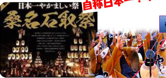
日本一やかましい祭