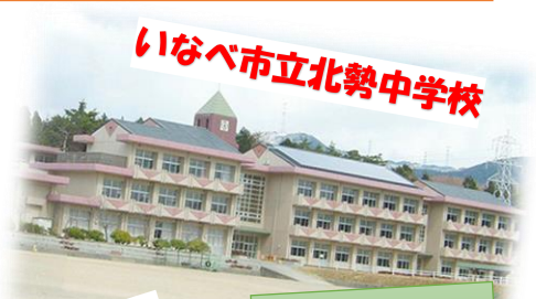
いなべ市立北勢中学校